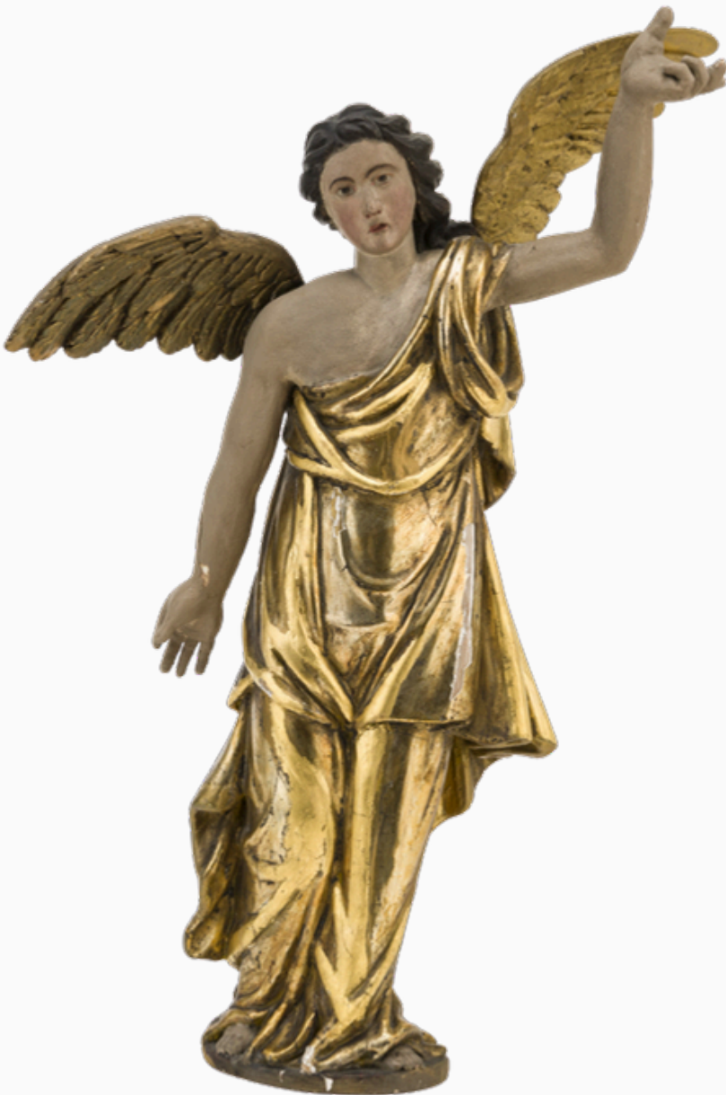
Statuette en bois polychrome doré. Elle servait au décor de la chapelle des saints (18 e siècle).

Le Pôle culturel fonde son action sur quatre valeurs fondamentales.