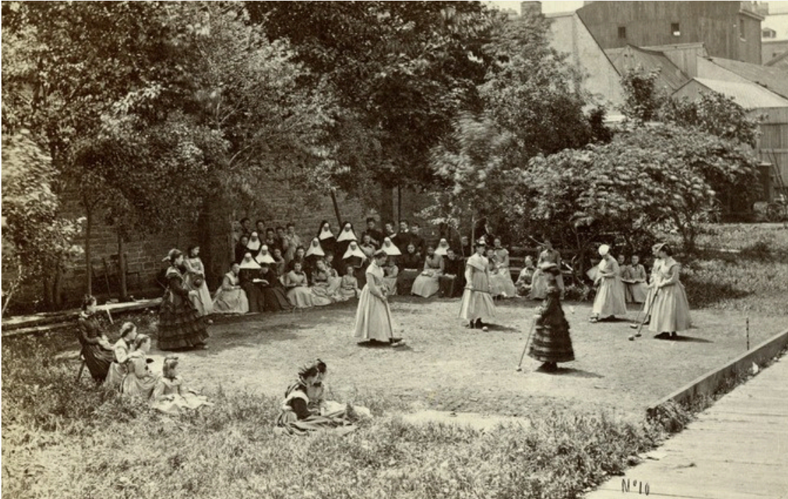
Groupe d'élèves jouant au croquet à la récréation, 1867.

Après quatre années de travail sur l'écriture du scénario, la scénographie et la sélection des artefacts et des archives, l'équipe accompagnée de Bergeron Gagnon inc. a amorcé à la fin du mois de janvier le montage du mobilier (dont le reconditionnement de vitrines offertes par le Musée de la Civilisation du Québec) et l'étalage des 609 artefacts et archives. Cette étape cruciale a été finalisée à la mi-avril, soit deux semaines avant le lancement officiel de la nouvelle exposition permanente.