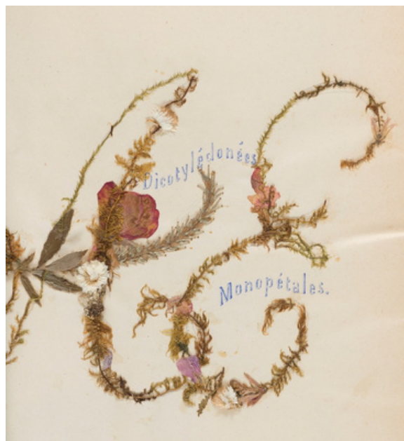
Détail de l'herbier d'Adèle Tessier, 1868.

La fermeture du musée pendant les quatre premiers mois de 2025 a entraîné une légère baisse de l'achalandage sur le site Internet du Pôle culturel. Celle-ci est passée de 27 079 personnes en 2024 à 24 854 personnes en 2025. La fréquentation demeure fortement concentrée durant la haute saison touristique (mai à juillet). Plus de la moitié (56,5 %) des internautes qui consultent le site du Pôle provient d'une recherche directe, ce qui témoigne d'une notoriété bien établie et d'un intérêt ciblé pour l'institution.