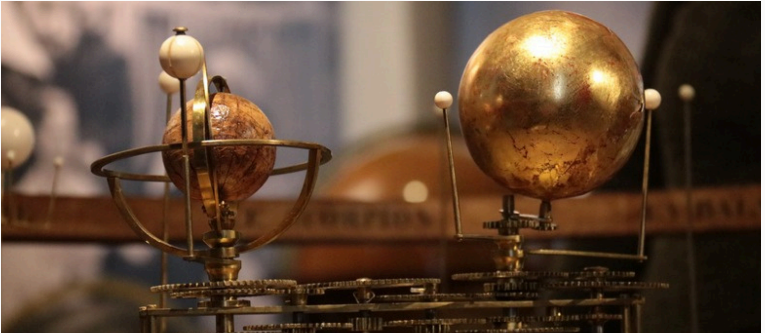
Détail de l'engrenage et des astres du planétaire de Copernic (19 e siècle).

Dans un souci de continuité et de saine gouvernance, la planification stratégique 2021-2024 a été reconduite pour l'année 2025 afin d'assurer une transition harmonieuse à la direction générale et de permettre l'élaboration d'une nouvelle planification stratégique couvrant la période 2026-2028.