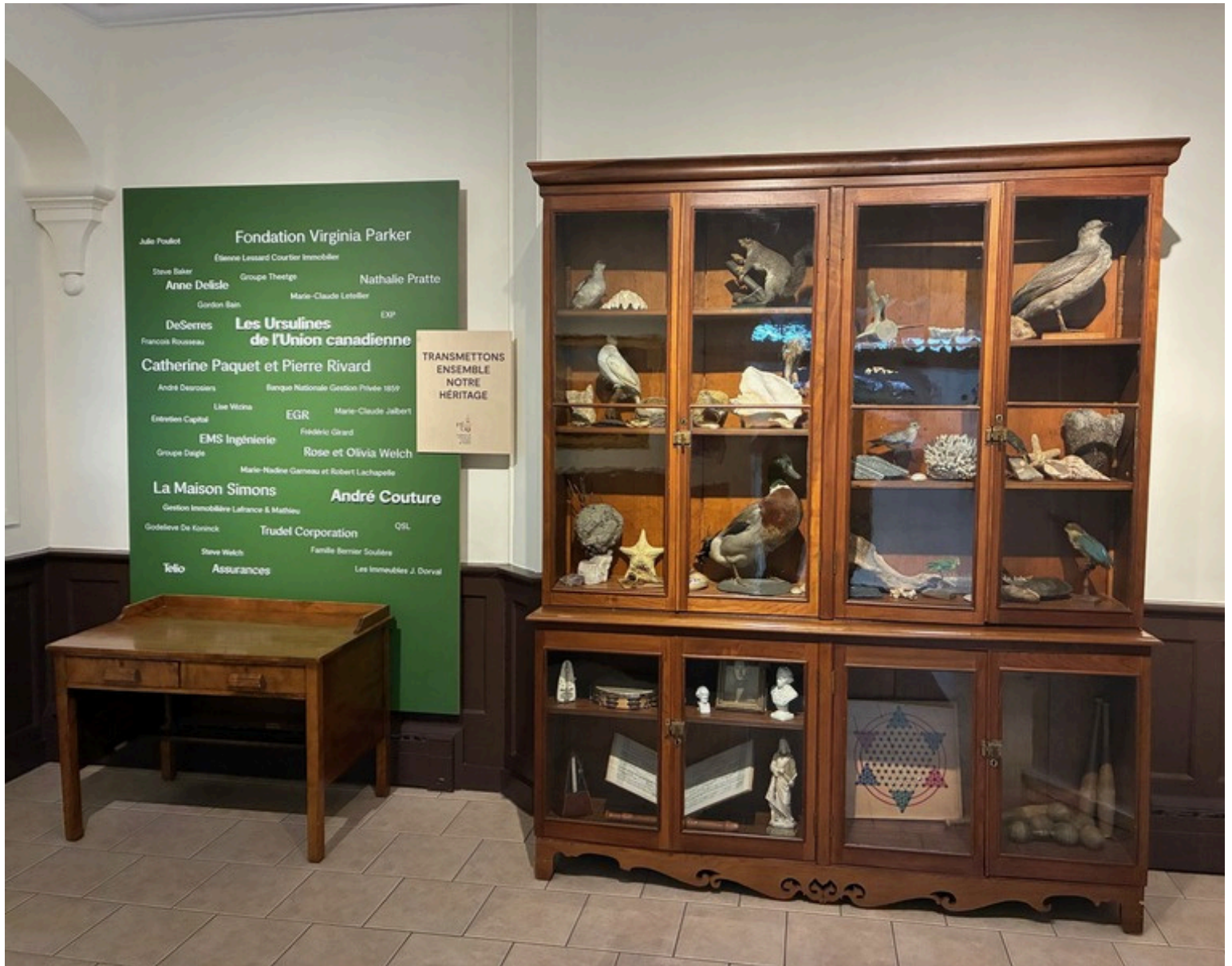
Vitrine de sciences naturelles dans le hall d'entrée de l'École des Ursulines réalisée par le technicien en muséologie.