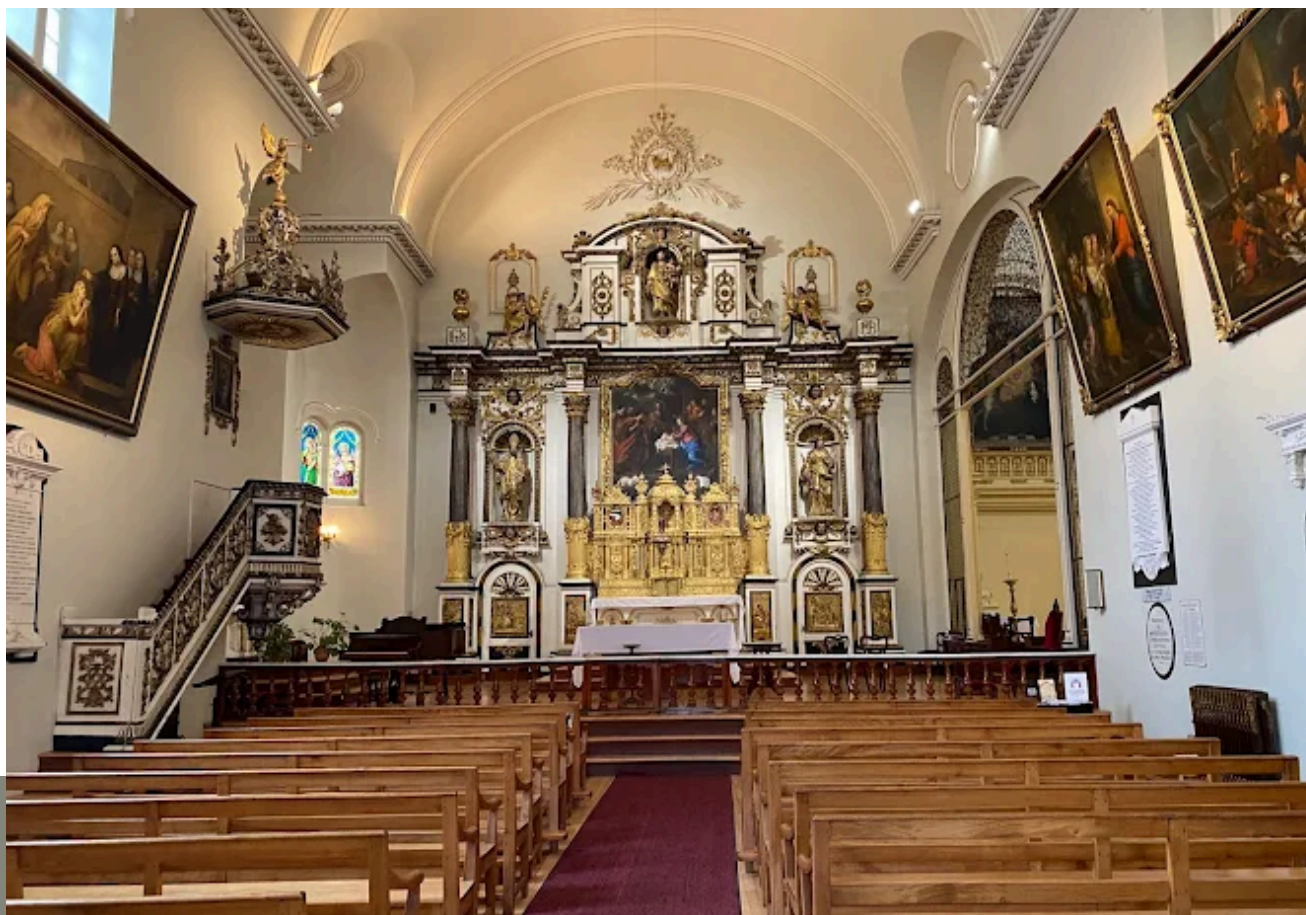
Vue de l'autel principal dans la chapelle.

Le Pôle culturel est fier de poursuivre la longue tradition musicale à la chapelle en plus d'y présenter conférences, visites guidées et autres activités qui mettent en valeur ses qualités patrimoniales et son acoustique exceptionnelle. Alors que le musée était temporairement fermé d'octobre 2024 à avril 2025, la chapelle est demeurée ouverte au public. L'expérience Échos du chœur , des visites commentées et plusieurs concerts y ont été présentés, permettant de maintenir un lien vivant avec les publics.