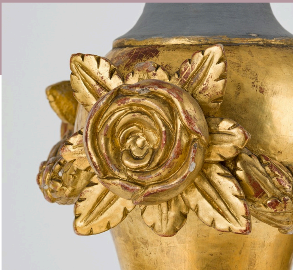
Détail d'un chandelier pascal attribué à Pierre-Noël Levasseur, 18 e siècle.

Le Pôle culturel estime qu'une gestion responsable des collections et des archives repose sur leur préservation, leur protection et le développement d'une connaissance approfondie des éléments qui les composent. Cette connaissance s'enrichit autant par les recherches menées à l'interne que par les travaux réalisés par des collaboratrices et collaborateurs externes. C'est dans cette perspective que le Pôle accueille chaque année des chercheuses, des chercheurs et des stagiaires.