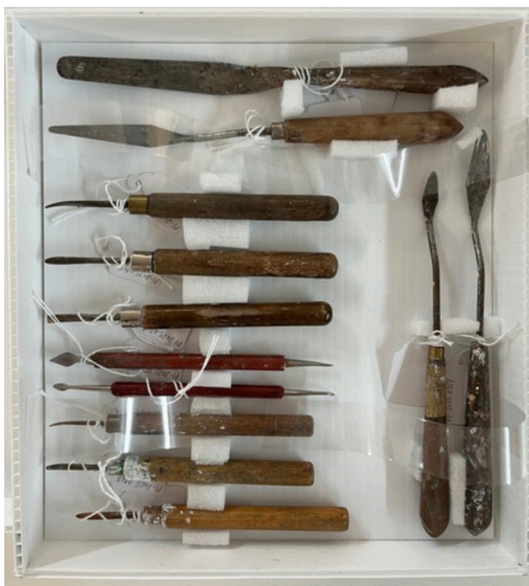
Boite compartimentée d'éléments du corpus sœur Louise Godin réalisée par une stagiaire.