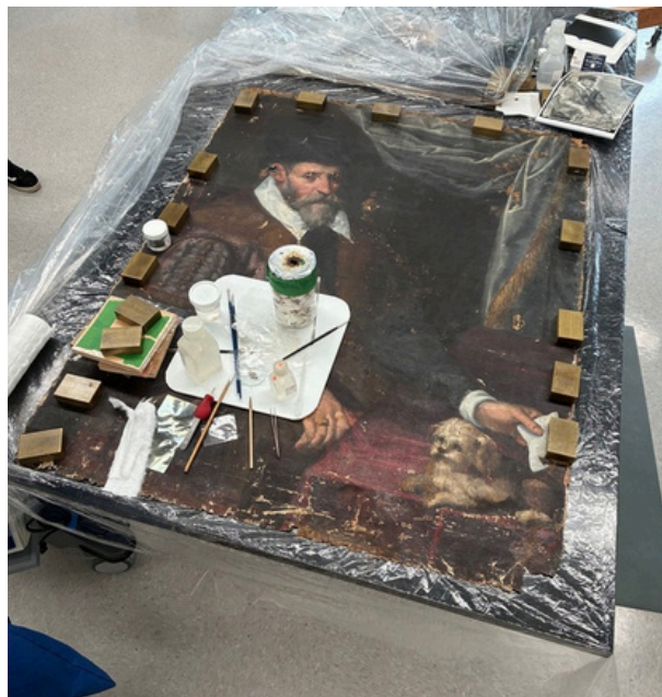
Portrait d'un marchand vénitien actuellement en restauration au Centre de conservation du Québec.

Quatre demandes de restauration ont été soumises au Centre de conservation du Québec (CCQ). La première concerne des statuettes de saint Joseph et leur niche. Deux autres demandes portent sur deux tableaux majeurs des collections : Sacré-Cœur , anciennement attribué au frère Luc, et Le Christ en croix de William Berczy, œuvre fondatrice de l'histoire de l'art religieux au Canada. Une dernière demande vise la restauration de trois reliquaires du 17 e siècle, parmi les plus anciens en Amérique du Nord, étroitement liés à l'histoire, aux pratiques dévotionnelles et à la vie spirituelle des Ursulines.