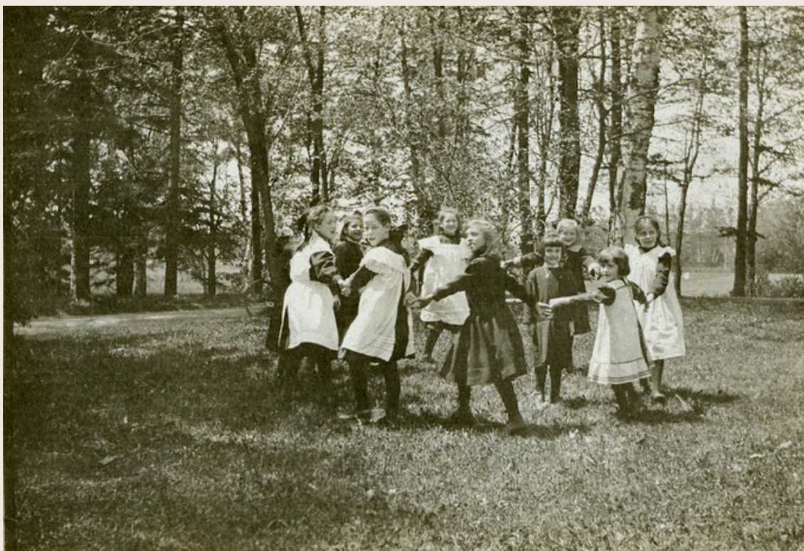
Groupe d'élèves du Petit Mérici, [1915].

En 2025, le musée a accueilli 8335 personnes dans le cadre de ses activités de médiation culturelle, dont 7170 entrées payantes et 1175 gratuites. Les événements (concerts, conférences, colloques, vernissages) ont réuni 3269 personnes, dont 671 payantes et 2598 gratuites.